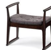
W205-41E1 張材: B17-02 (ブルー) 布