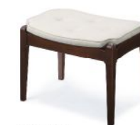
W200-80E1 張材: A07-01 (ホワイト) 合