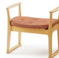
W205-41N5 張材: A08-02 (オレンジ) 布