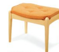
W200-80N5 張材: B05-03 (オレンジ) 布