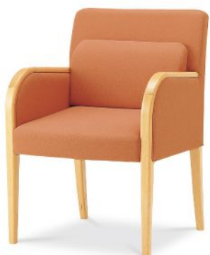
W391-41N5 張材: B15-05 (オレンジ) 布

アームチェア W391-41N5 ¥84,000 (¥80,000) W570・D640・H830・SH430 重量: 11.6kg 脚部: プナ