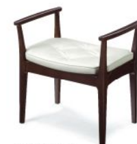
W200-41E1 張材: A07-01 (ホワイト) 合

スツール W200-80E1 (ダークブラウン色) W200-80N5 (ナチュラル色) ¥26,250 (¥25,000) 張材ランクA ¥27,090 (¥25,800) 張材ランクB W565・D410・H440・SH420 重量: 5.4kg 脚部: ラバーウッド