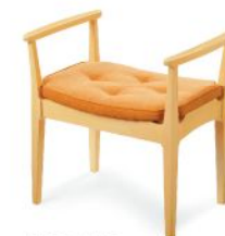
W200-41N5 張材: B05-03 (オレンジ) 布