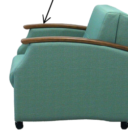
スリーパーチェア・高級タイプ

肌にやさしい天然木を使い、 立上がりやすさを考慮に入れた デザインで、お手入れも簡単です。