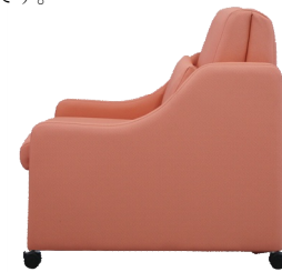
スリーパーチェア・普及タイプ

W695・D820・H810・SH405 (イスの時) W695・D1815・H645・SH365 (ベッドの時) (* ベッドサイズ: 570 x 1815) 張材: A02-02 (オレンジ) ビ 脚部: ロック機構付キャスター 定価: ¥199,500 (¥190,000)