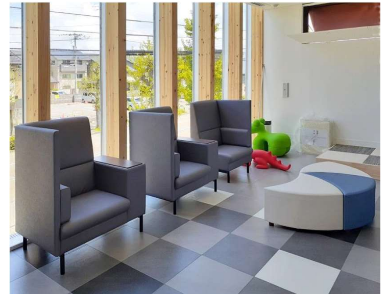
2F 待合 オアシス、ローリエ、ミニボニー、ディーノ