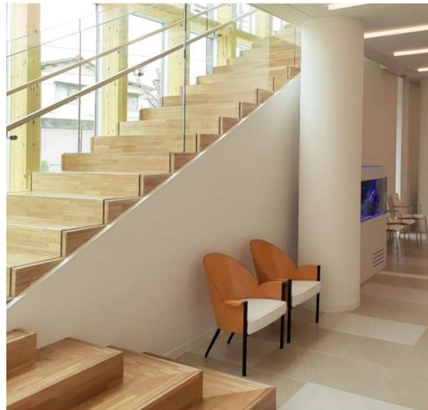
1F 待合 S3500 テーブルアームチェア、L2078 ヘキサスツール