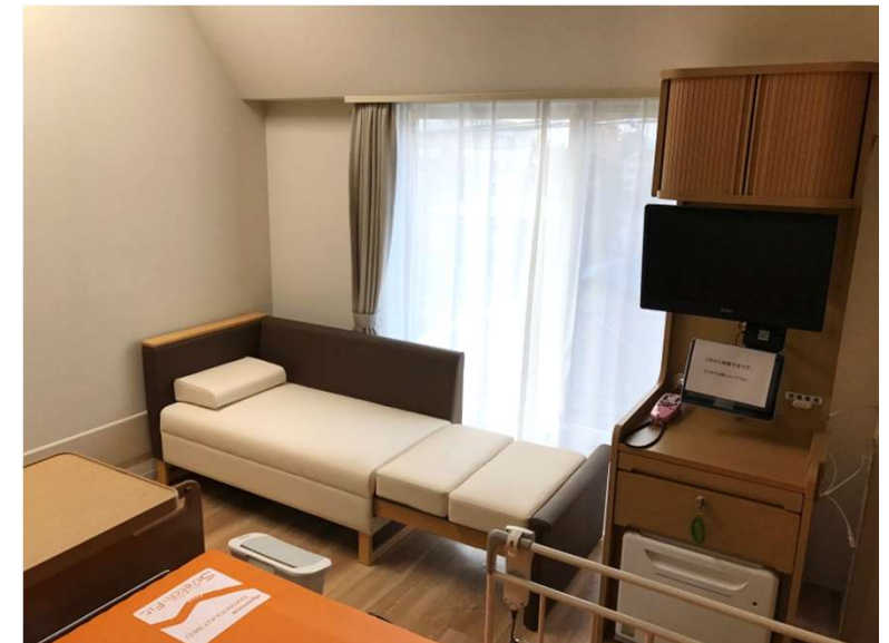
北館 個室 スリーパーソファ L1008