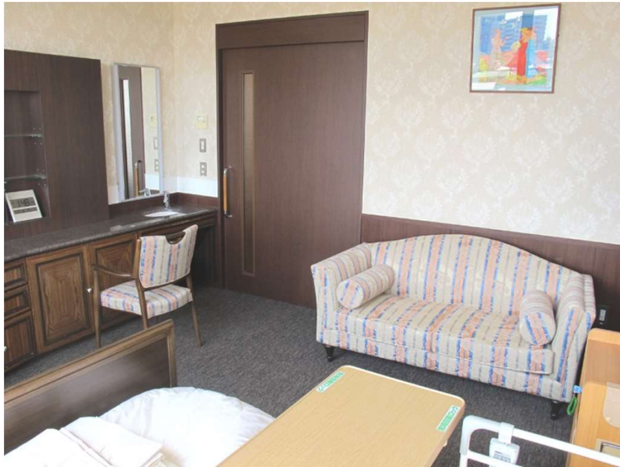
南館 特別室A L116 リリーソファB