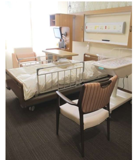
南館 個室 L1007 スリーパーチェア ABチェアW1100