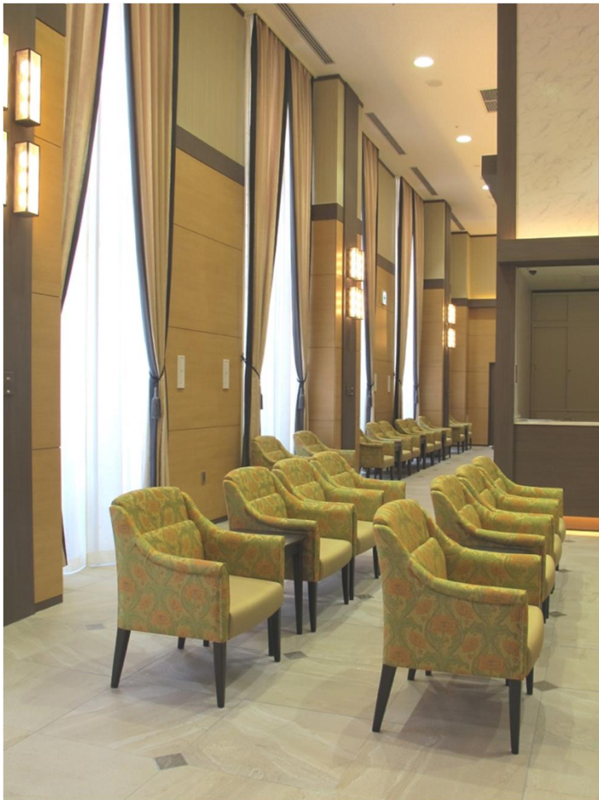
北館 産科待合 W085 ロールアームチェア(妊婦イス)