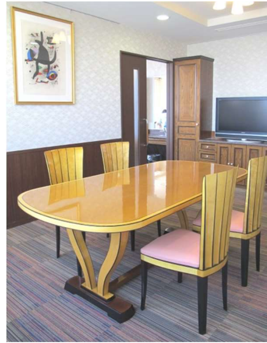
南館 特別室A ES-8050 サイドチェア