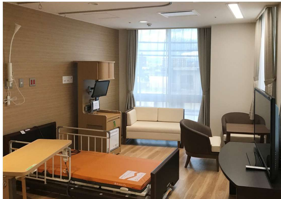
北館 特別室 スリーパーソファ L1008 シフォンソファ W400