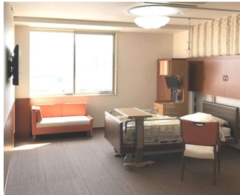
南館 個室 L1108 スリーパーソファABチェア W1100