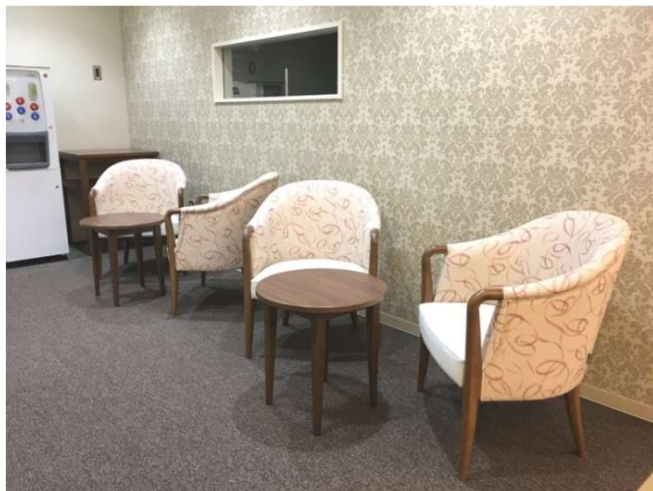
南館 ラウンジ W770 ウッドグリップチェア