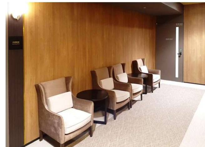
5F 中待合 L2002 レディースウィングチェア