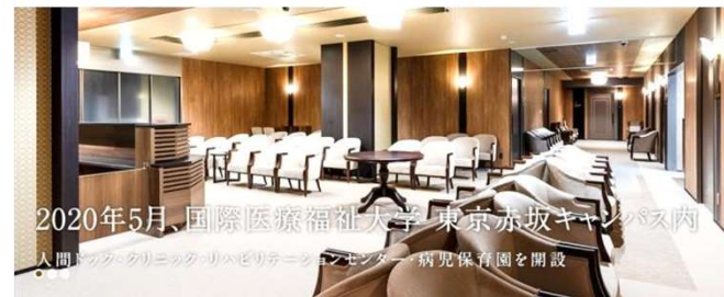
2020年5月、国際医療福祉大学 東京赤坂キャンパス内 人間ドック・クリニック・リハビリテーションセンター 病児保育園を開設

質の高い人間ドックと内科・整形外科・小児科診療、 リハビリテーションを赤坂見附の地で