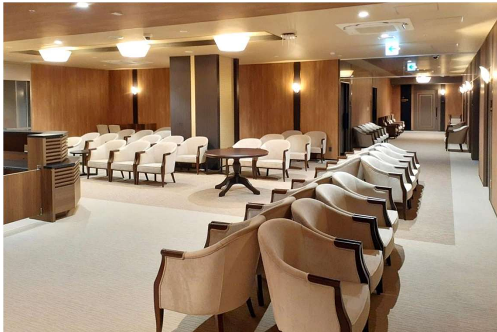
4F 総合待合 W821 ビーダーマイヤー・ラウンドチェア