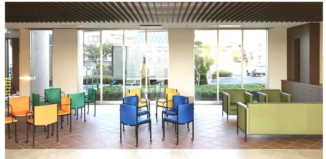
1F エントランスホール S401-41RB ダンチェア、L5500-41/43 マンハッタンソファ