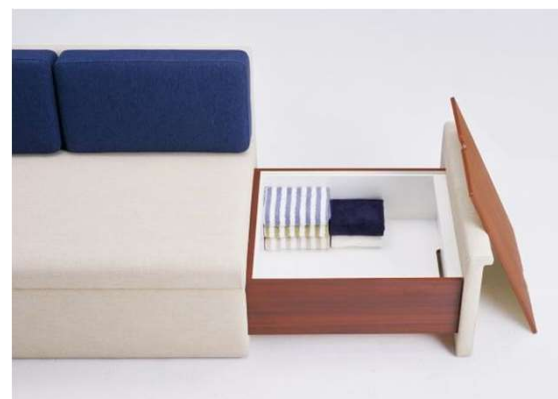
収納スペース寸法 550 x 485 x 175 容量約50リットル