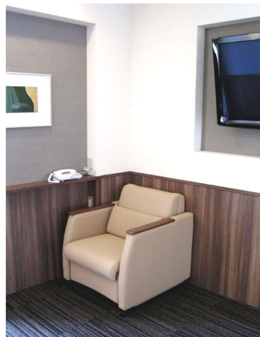
居室 スリーパーチェア