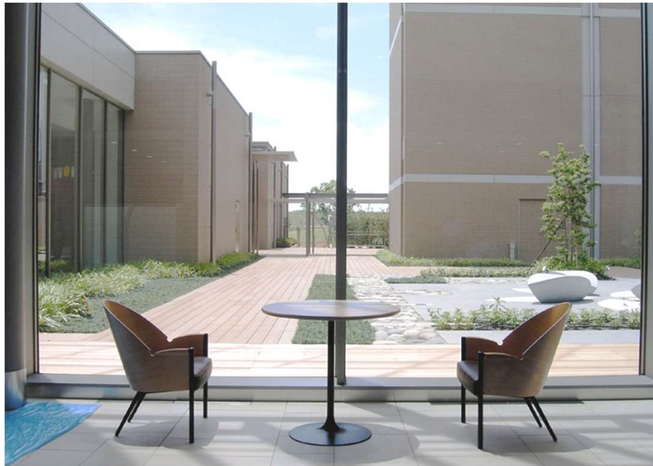
ホスピタルストリート S027