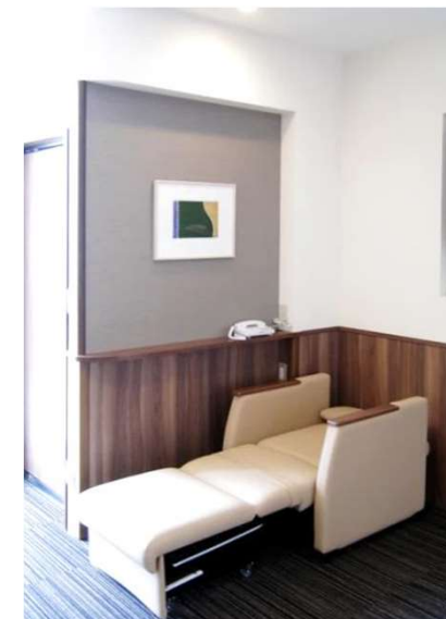
個室 スリーパーチェアが使われています。