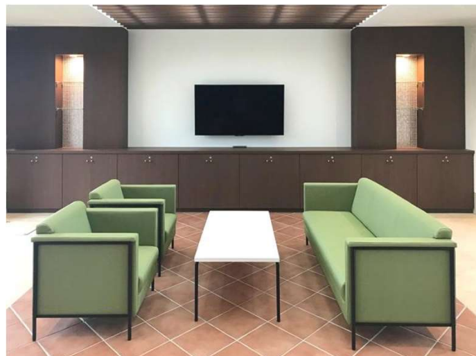
1F エントランスホール L5500-41/43 マンハッタンソファ