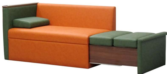
スリーパーソファ B（収納ボックスタイプ） L1118-22K7 サイズ：W1295・D700・H700・SH400・AH685 W595・D1825（ベッドサイズ）