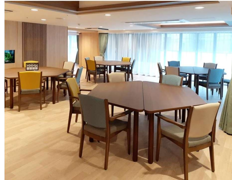
食堂 W878-41K7 ホールドチェア