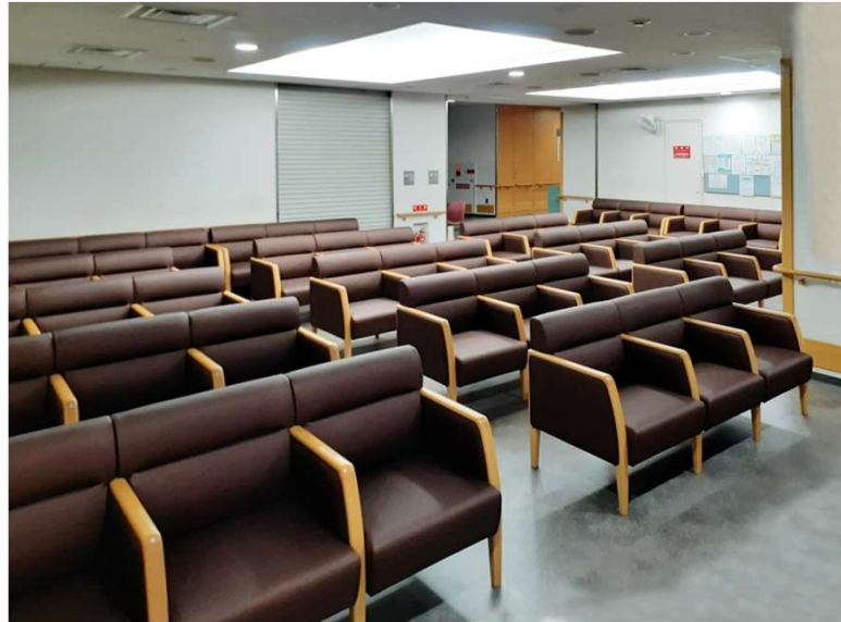
1F 総合待合 L811-43N5 ヌー・ロビーチェア