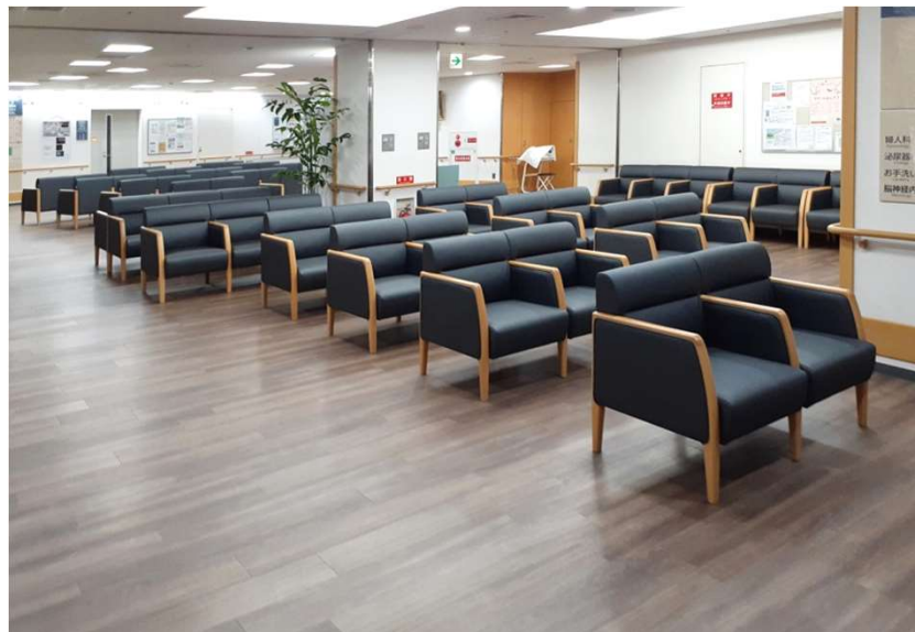
2F 総合待合 L811-42/43N5 ヌー・ロビーチェア