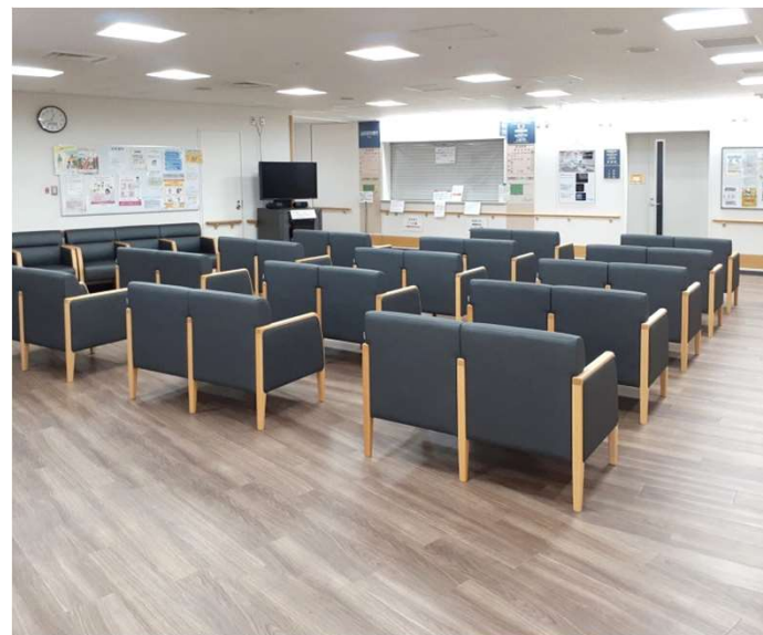
2F 総合待合 L811-42/43N5 ヌー・ロビーチェア