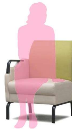
右肘付 D2210-21GM ¥83,000(税込¥91,300) *Bランク W570・D615・H800・SH400

片肘付き、両肘付き、肘なしをそろえ、くっつけたり、離したりとそれぞれの場所に合わせ組み立てが容易です。コロナウィルス収束後は、元に戻し、通常のロビーチェアとしてお使いいただけます。