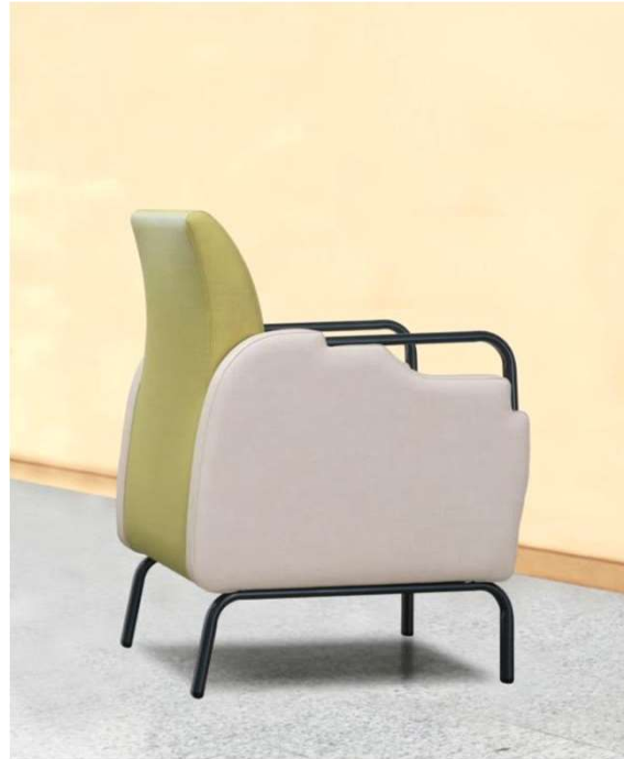
全体に柔らかい曲線のフォルム、 ダエンパイプの肘は握りやすく機能的。