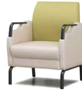
両肘付 D2210-41GM ¥102,000(税込¥112,200) *Bランク W630・D615・H800・SH400