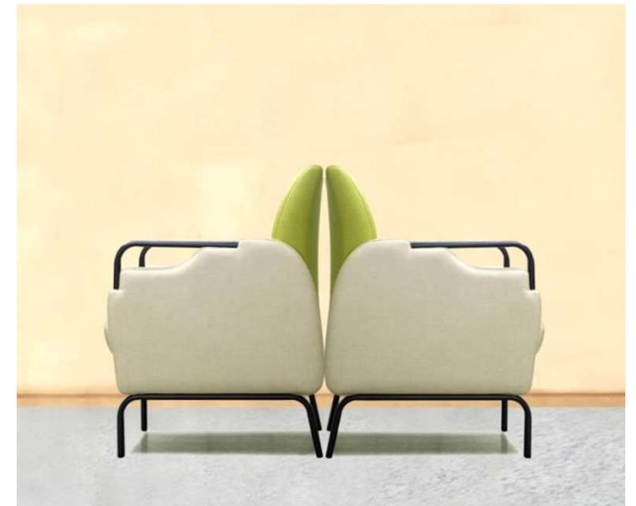
美しい曲線の背もたれ、 背中合わせも美しく配置できます。