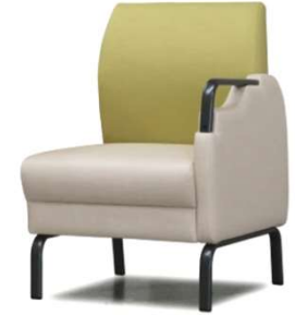
左肘付 D2210-31GM ¥83,000(税込¥91,300) *Bランク W570・D615・H800・SH400