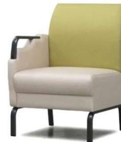
右肘付 D2210-21GM ¥83,000(税込¥91,300) *Bランク W570・D615・H800・SH400