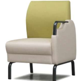
左肘付 D2210-31GM ¥83,000(税込¥91,300) *Bランク W570・D615・H800・SH400