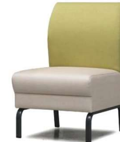
肘なし D2210-11GM ¥64,000(税込¥70,400) *Bランク W520・D615・H800・SH400