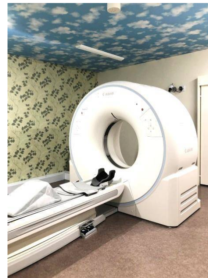
キヤノンCT診断装置